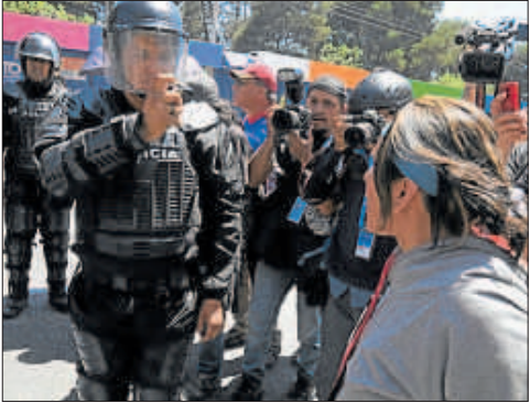
• Un policía antimotines filma a una persona que protestaba en el norte de Quito.