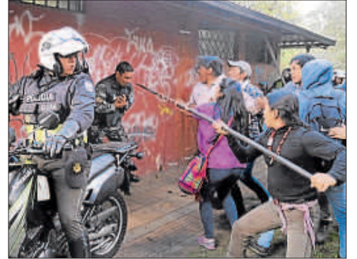
• El jueves, en el parque El Ejido, manifestantes agreden a uno de los uniformados.

Añadió que presentará un recurso de hábeas corpus para que un juez superior revise la actuación del juez. La razón: “no ha existido una sola evidencia en contra de mis defendidos para esa sanción”.