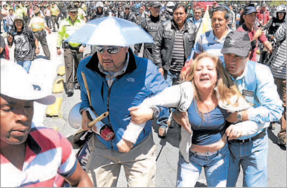
A la s15:00, una mujer fue detenida afuera del Instituto Ecuatoriano de Seguridad Social.