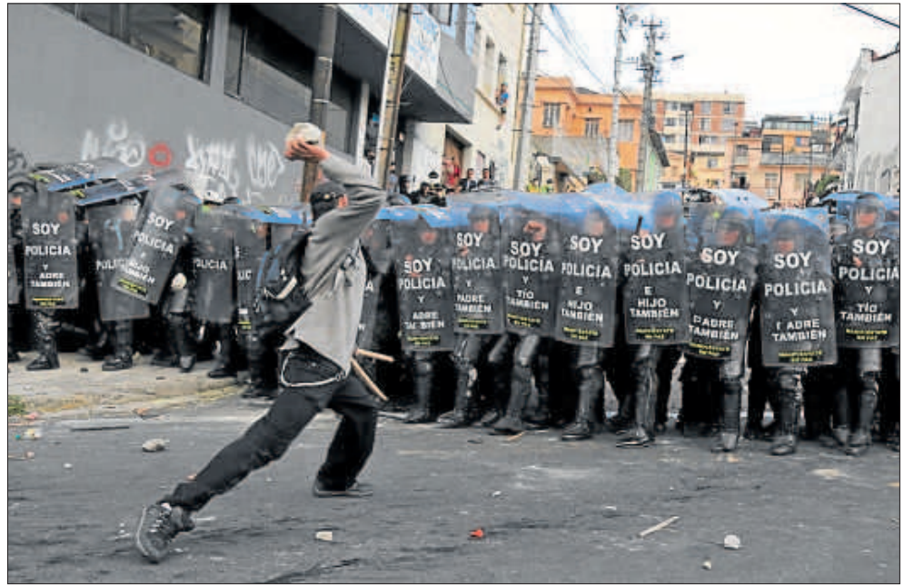
• La tarde del jueves, en av. 12 de Octubre, una persona lanza una piedra contra de los agentes.