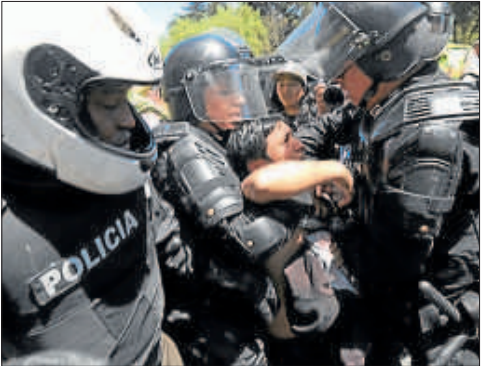
• Agentes aprehendieron a un joven que participaba en la marcha contra las enmiendas.