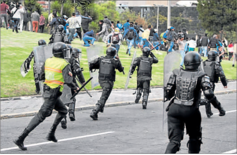
• El jueves 3 de diciembre, en El Arbolito, policías antimotines siguen a los manifestantes.