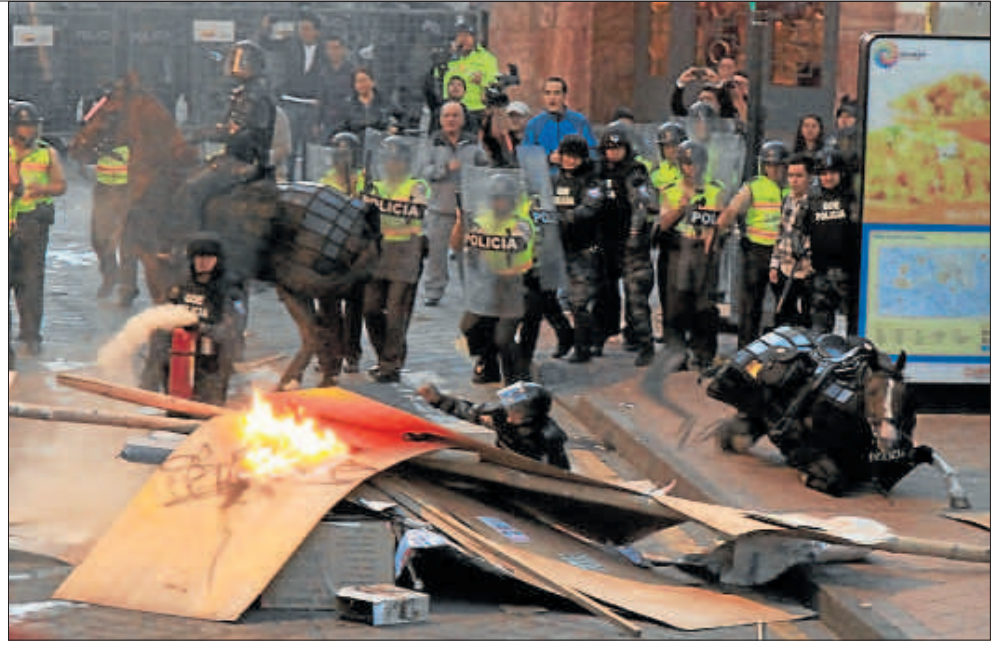
• En Cuenca, un policía que iba en un caballo sufrió una caída en medio de la protesta.