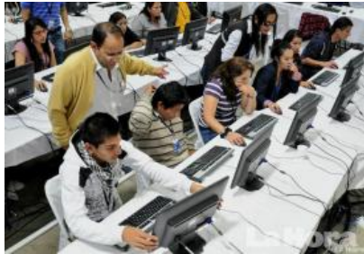
En el coliseo del colegio Benalcázar, en Quito, realizan la verificación de firmas.